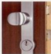
Stahl - Sicherheitsbeschlag mit Kernziehschutz