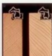
Echtholzstaffel mit Dichtung