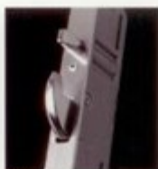
Hakenriegel einzigartig bei Profisafe